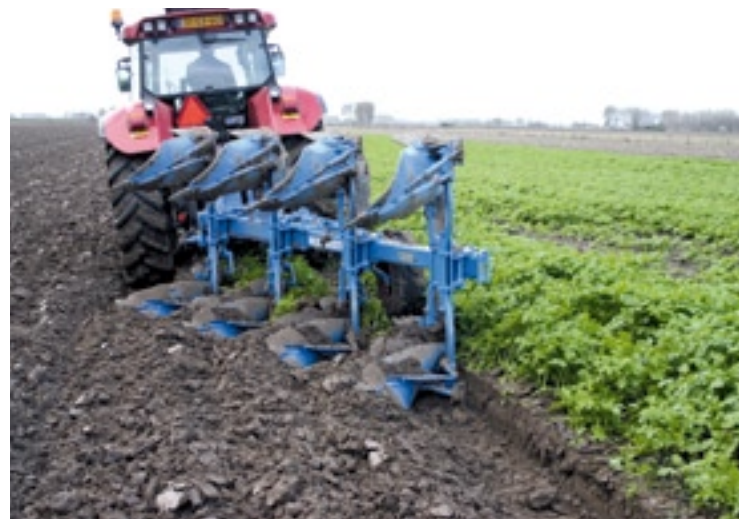
▲ De risters hebben een goede kerende werking, de sneden sluiten netjes aan.